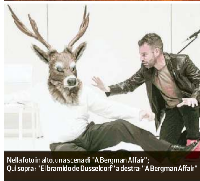
Nella foto in alto, una scena di "A Bergman Affair"; Qui sopra: "El bramido de Düsseldorf" a destra: "A Bergman Affair"